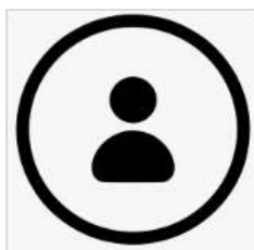
FOTO DE PERFIL